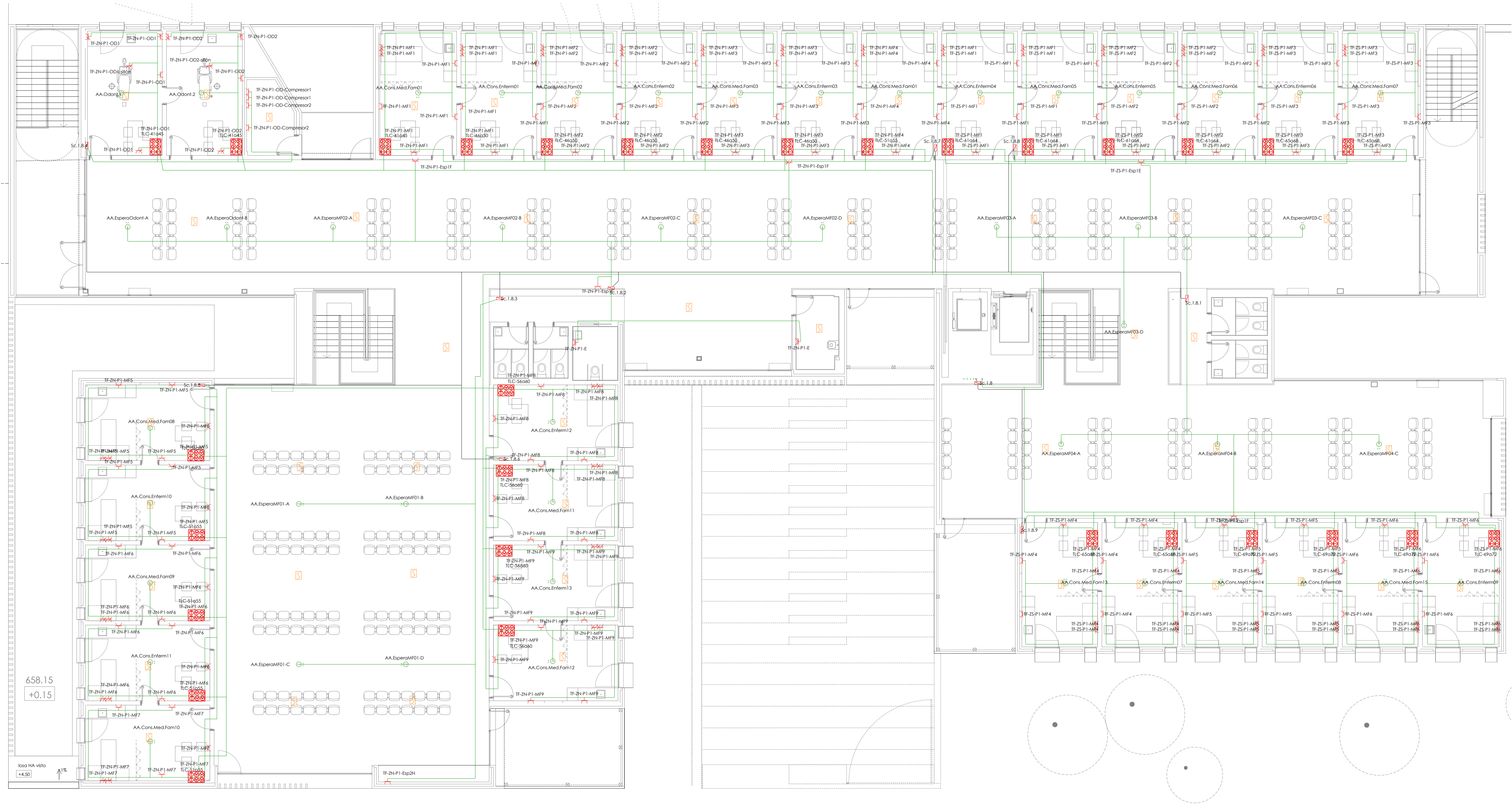
PLANTA PRIMERA -- E: 1/100